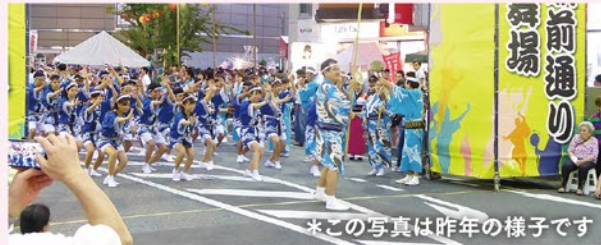
*この写真は昨年の様子です

8月25、26日の「第34回南越谷阿波踊り」に今年も「りっちゃん連」連長として参加します。「元気に笑顔で楽しむ!」をモットーに子供からお年寄り、また留学生まで元気に毎週練習しております。是非、会場でお会いしましょう!