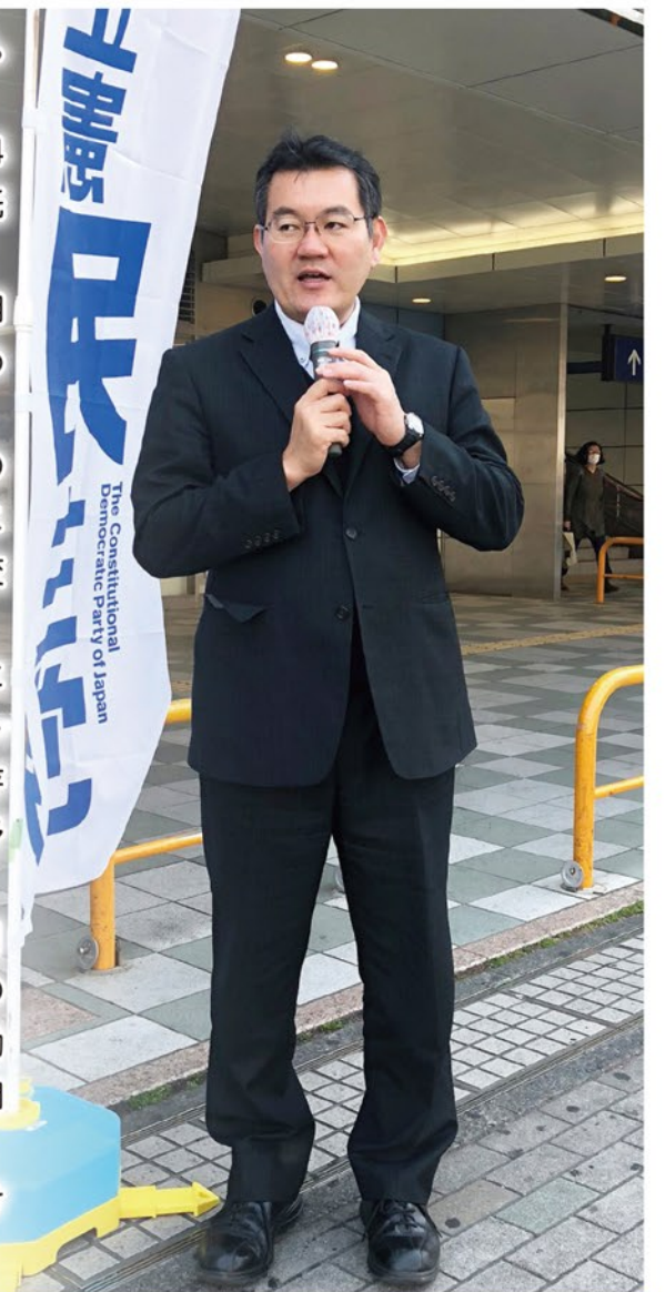
(4月19日北越谷駅にて)