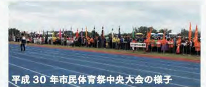
平成30年市民体育祭中央大会の様子

毎年、体育協会やレクリエーション協会加盟団体など多くの方々が開会式にご参加いただいていることから今年度より各協会加盟団体のアピールリレーを実施、幅広い世代の方々にご参加いただきました。今後も、より多くの皆様にご参加いただける中央大会になるよう取組んでまいります。