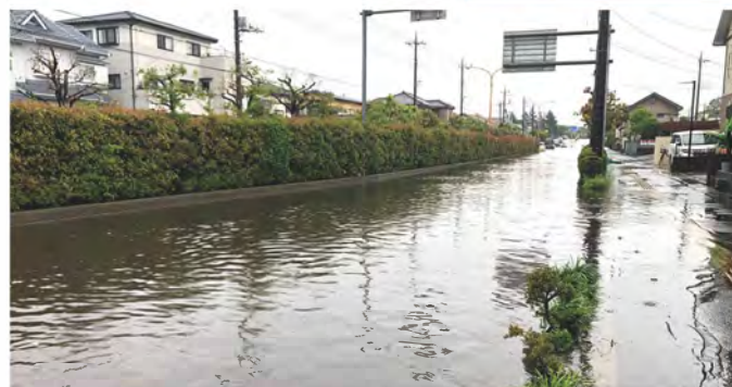
水害調査 道路冠水