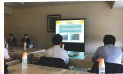
水防警報迅速化システム