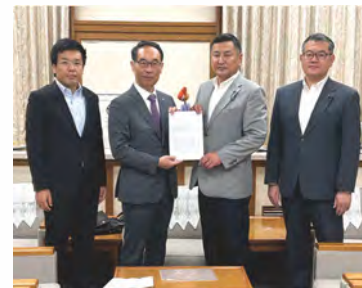
台風2号要望書提出