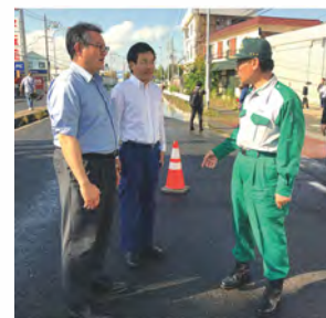
県知事とともに水害視察