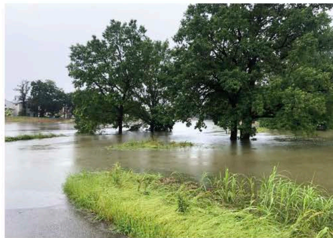
令和5年 台風2号 元荒川の様子