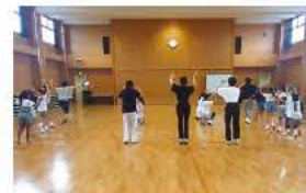
南越谷阿波踊りりっちゃん連続練習中