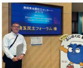
地震防災センター（静岡県）