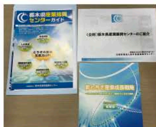
アントラズホームタウンDMO（茨城県）