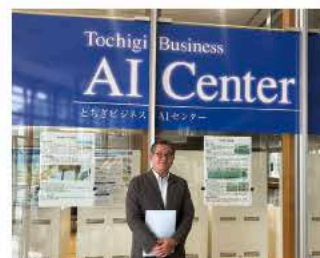
とちぎビジネスAIセンター（栃木県）