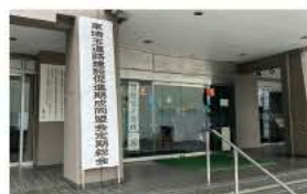
5月16日第44回東埼玉道路建設促進期成同盟会の定期総会