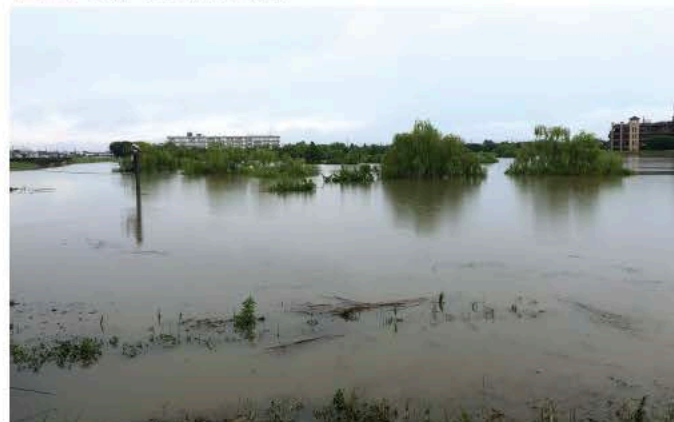
令和5年 台風2号 大吉調節池の様子