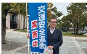
4月6日春の全国交通安全運動出発式