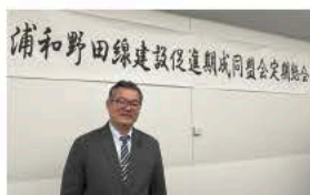
5月16日第52回浦和田線建設促進期成同盟会の定期総会