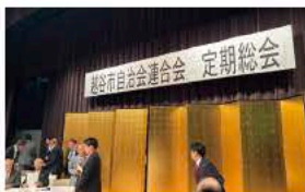
6月1日越谷市自治会連合会定期総会