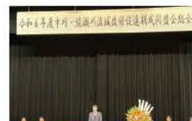
5月20日中川・綾瀬川流域改修促進期成同盟会