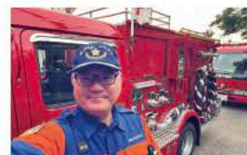
5月19日消防団統一訓練