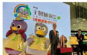
6月15日全国植樹祭1年前記念イベント