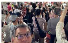
6月2日アルファフェーズ祝賀パレード