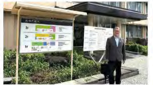
5月14日 埼玉県春日部農林振興センター訪問