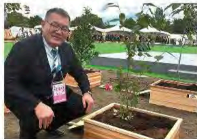
5月25日 第75回植樹祭in秩父ミュージックパーク