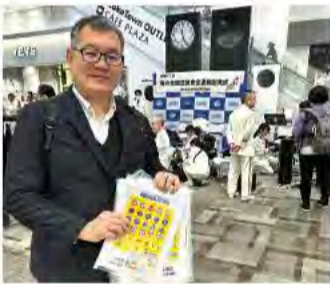
4月5日 春の交通安全運動出発式