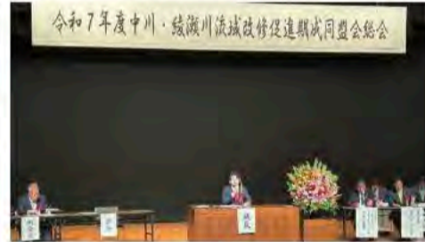
5月19日 中川・綾瀬川流域改修促進期成同盟総会