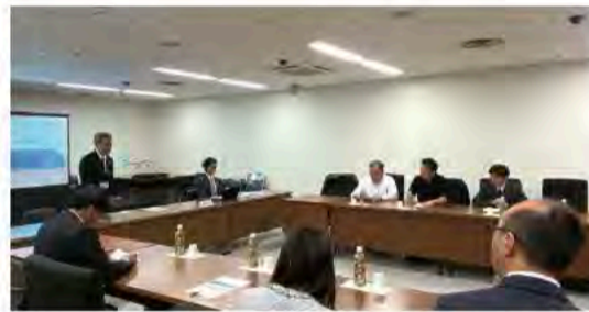
5月8、9日 会派視察(京都・奈良)メリデン版訪問家庭 支援、更生支援の取組を視察