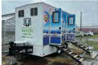
5月17日 越谷市のトイレトレーラーを視察