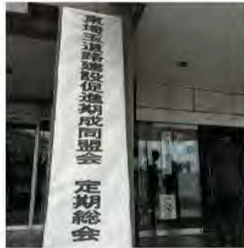
5月16日 東埼玉道路 建設促進期成同盟会総会