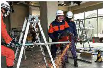
5月11日 消防団統一訓練