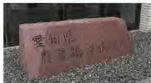
5月28、29日 環境農林委員会視察(岐阜・愛知)リサイクルタイル会社、農業総合試験場を視察