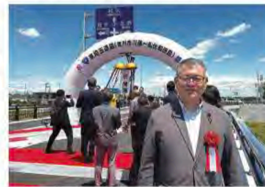
6月1日 国道4号東埼玉道路 (吉川市藤川～松伏町田島) 開通式