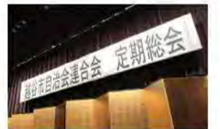
6月7日 越谷市自治会連合会の 定期総会