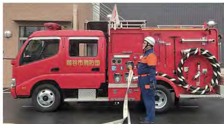
12月 消防操法大会出場隊選考会に参加

社会や経済を取り巻く環境が大きく変化する中で、政治には、暮らしに寄り添った判断と責任ある対応が一層求められています。12月県議会では、こうした社会状況を踏まえ、物価高への対応や県民の安全・安心を守る施策を中心に、慎重な審議が行われました。県議会は、県民の代表として議論を尽くすとともに、国の動向を踏まえながら、市町村と緊密に連携し、実効性ある政策につなげていく役割を担っています。本レポートでは、12月定例会における主な議論や決定事項について概要をお伝えしております。今後も県民の声に真摯に向き合い、信頼される県政の実現に向け、全力で取り組んでまいります。