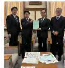
11月14日 越谷市の治水対策要望書