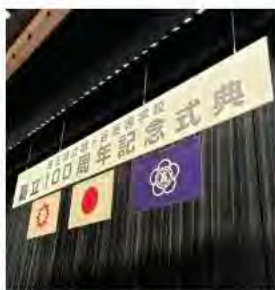
11月2日 越ヶ谷高等学校 創立100周年記念式典