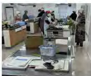
11月27日 子ども食堂視察