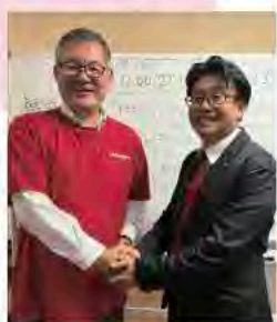
10月26日 越谷市長選挙