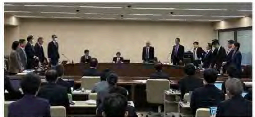
八潮市道路陥没事項調査等特別委員会の様子

八潮市で発生した道路陥没事故では、周辺の皆さまが長く不安やご不便を抱えておられ、その心労は計り知れません。県は下水道管の復旧工事や国からの財政支援の確保を進めていますが、総額278億円を超える大きな事業であることから、状況の丁寧な説明と、より分かりやすい情報発信が求められます。補償についても、自動車部品の腐食や電気代の増加、家屋への影響など、それぞれの事情に寄り添った対応をさらに進める必要があります。健康面の不安に対する相談体制の整備も重要です。県には、住民の皆