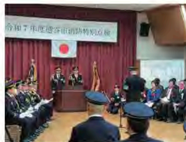
11月9日 消防特別点検