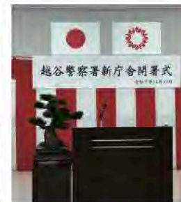
11月12日 越谷警察署新庁舎開署式