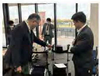
12月20日 こしがや介護フェスタ