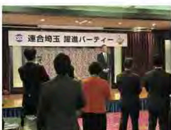
11月19日 連合埼玉躍進パーティー