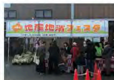
12月6日 産地地消フェスタ